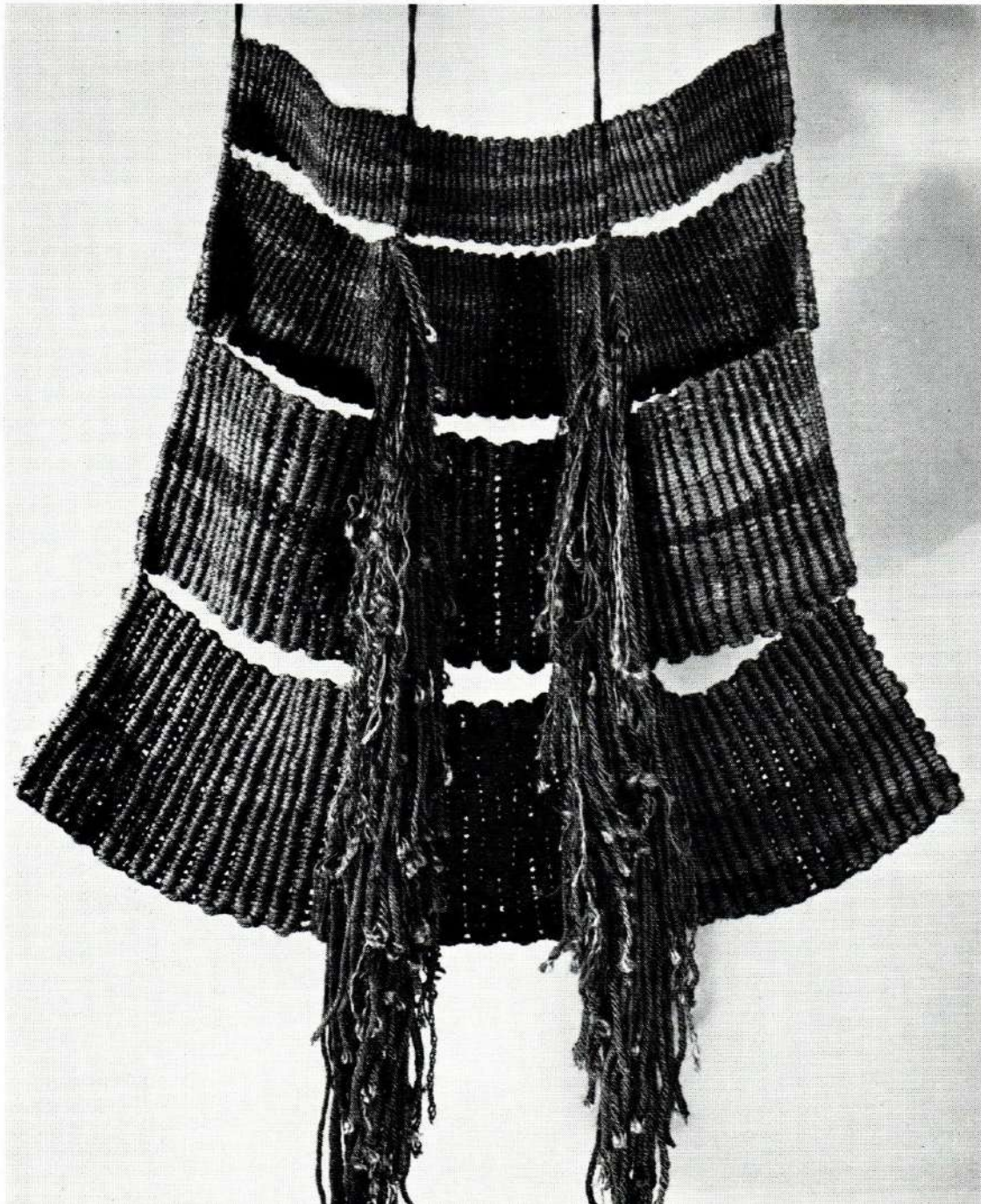
Capa Pluvial alcària 1,50 m, base 1,30 m.